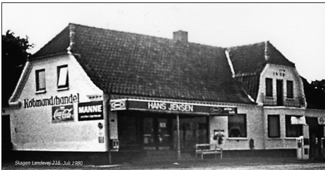
Skagen Landevej 216. Juli 1980