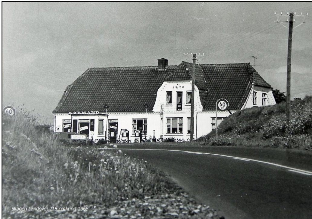
Skagen Landevej, 216 omkring 1966