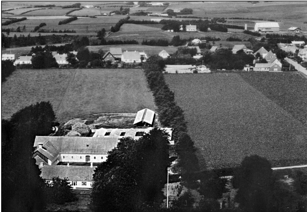
"Gedemaalsgaard" omkring 1965 efter etablering af minkfarmen.