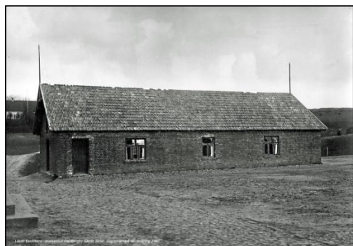
"Øvelseshuset" ved Bjergby Skole. ( bygget 1892)