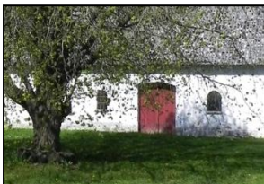
Den gennemhullede ladedør!