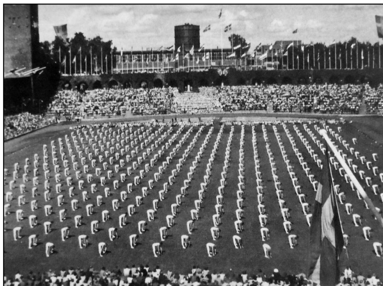
Vores gymnastikhold på Stockholm Stadion, Lingiaden 1949