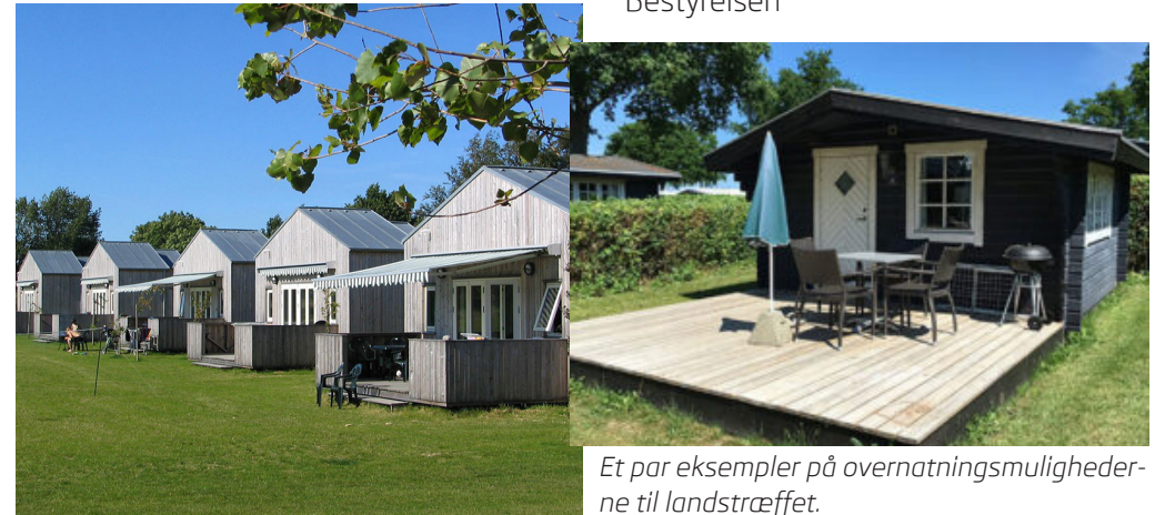
Et par eksempler på overnatningsmulighederne til landstræffet.